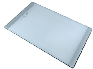
PLANCHE DE DECOUPE CRYSTAL

* uniquement en combinaison avec l'accessoire A644 F04