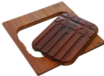
PLANCHE DE DECOUPE DOUBLE