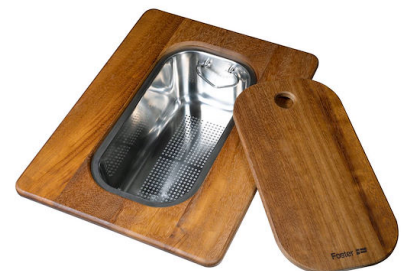
PLANCHE DE DECOUPE DOUBLE IROKO