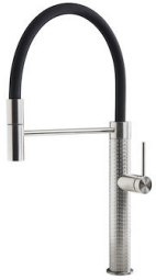
INCISO R424 A00